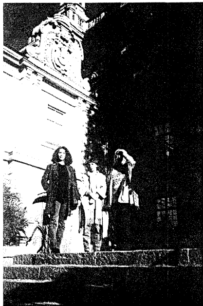
Перед входом в здание полиции.

в г. Стокгольм, посетить «рейв-комиссию» стокгольмской полиции, работающую с молодежью по профилактике наркомании, социальные службы в г.Карлстаде и поучаствовать в книжной ярмарке «Bok o` Bibliotek`2000» в г. Гётеборг.