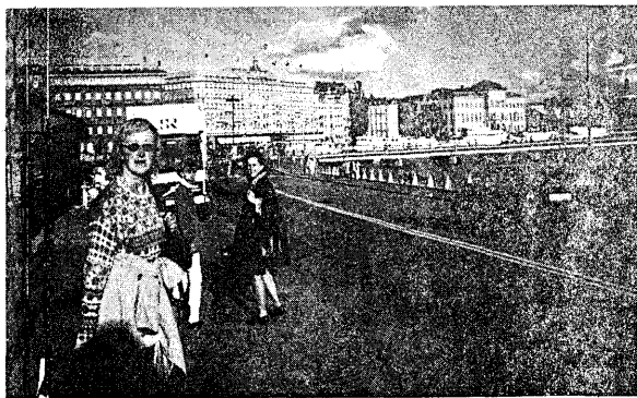
Стокгольм. Вид на старый город.