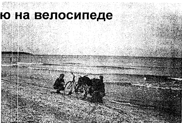
Одесса. У Черного моря.

Небольшой городишко Корец поверг нас в большое удивление. Нам показалось, что каждая главная улица там имеет свой храм. Мы зашли только в один – Свято-Троицкий женский монастырь и обнаружили там божественную красоту внутренней отделки, а во дворе – надгробие Анны Олениной, которой Пушкин посвятил много своих творений. В Корце Анна Оленина жила со своими детьми и внуками, делая большие пожертвования монастырю.