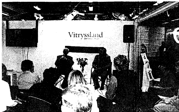
Гётеборг. Книжная ярмарка. Беларуский стенд.

С 6 по 18 сентября 2000г. члены «Калегіума» были с визитом в Швеции по приглашению Association for the Support of Kalegium и RNS.