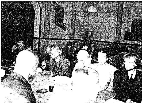
Пад час паседжання Першай Асамблеі

У траўні - ліпені 1998 году ў Горадні, Віцебску, Магілёве, меле прайсці абласныя форумны дэмакратычных няўрадавых арганізацыяў, вынікам якіх стала стварэнне Гарадзенскай, Віцебскай, Магілёўскай і Гомельскай абласных Асамблеі дэмакратычных НА. Нарэшце, на пачатку верасня 1998 году больш за 90 прадстаўнікоў няўрадавых арганізацыяў Берасцейскай вобласці сабраліся на сваю I-ую Асамблею. Пад час паседжання былі абраныя Асамблеяўскія структуры - Рабочая група, прынята рэзалюцыя.