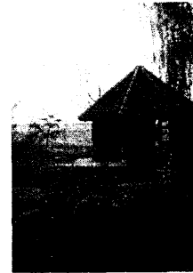
Альтанка, якую я дапамагаў будаваць.

Спажывецкія тавары даволі танныя, пры добрай нямецкай якасці вырабаў. Напрыклад мужчынскія зімнія боты – 16000 рублёў, красоўкі любога памеру – 9000 руб. Вядома, берагчы кожную капейку вы не зможаце, але даводзіцца гэта рабіць,