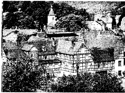
Чорныя бэлькі, белыя мury, шэрыя шыферныя дахі - гэта фахверкавы стыль, тыповы для Вестфаліі.

Цяжка расказаць, што давалася перажыццям перасяленцаў потым. асабліва ў XX стагоддзі пры "бацьку ўсіх народаў" – крывавам Сталіне. Частка іх была выселена ў Сібір. Многіх расстралялі без суда і следства. Але мужны народ трымаўся. Немцы на тэрыторыі СССР паказвалі прыклад дастойнага жыцця нават у такіх умовах. Нягледзячы на ўсе цяжкасці і перашкоды, іхнія