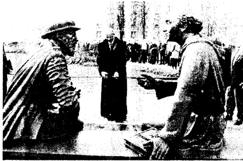
■ Помнік В.Цяпінскаму і С.Будному.

Бачачы пагрозу паланізацыі, Сымон Будны рашуча выступіў на абарону беларускай мовы: “Абы вашы княжацкія міласці любілі