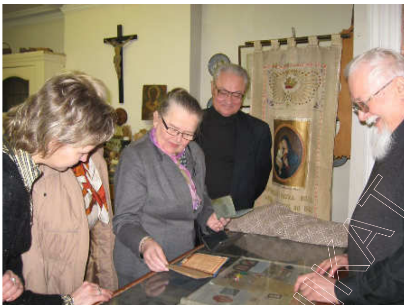
У музейнай зале Бібліятэкі імя Ф. Скарыны ў Лондане

Інфармацыйны цэнтр МГА “ЗБС “Бацькаўшчына”