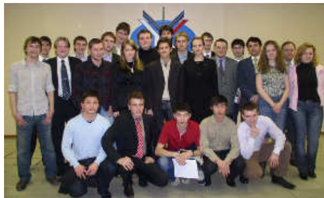
Адкрыццё беларускага зямляцтва ў Маскве

Украінцы шануюць змагароў за Незалежнасць Беларусі.