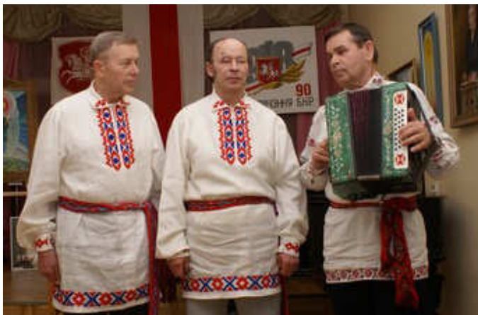
90-годдзе БНР у Рызе (Латвія)