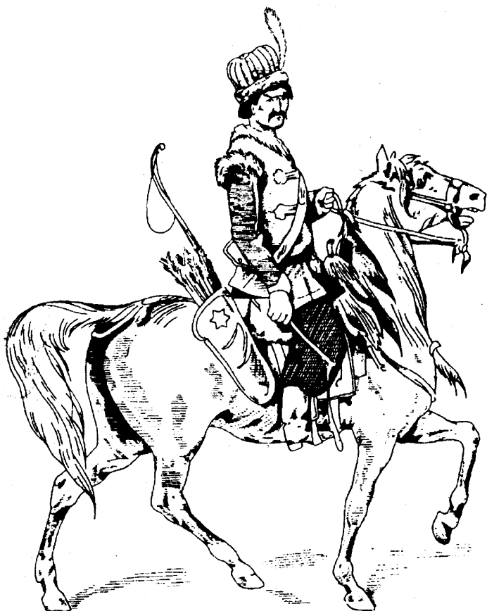
Татарскі ротмістар ў войску Вялікага Князтва Літоўскага