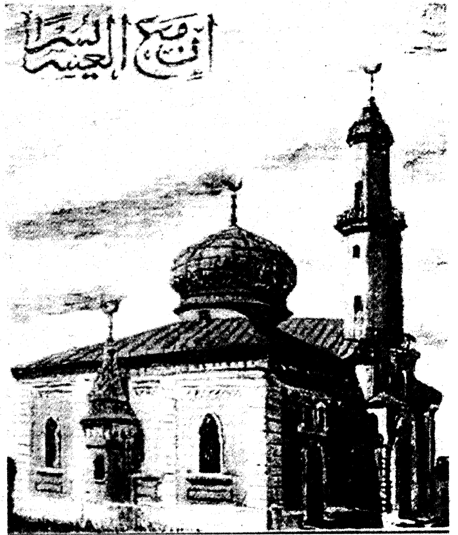
Менская мячэта, якая знаходзілася на месцы гатэля "Юбілейны" і была зруйнаваная ў 60-ыя гады нашага стагодзьдзя.