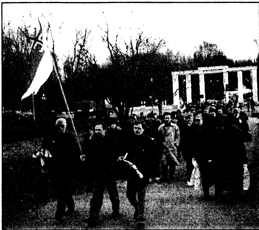
Шэсьце ў Маладэчна