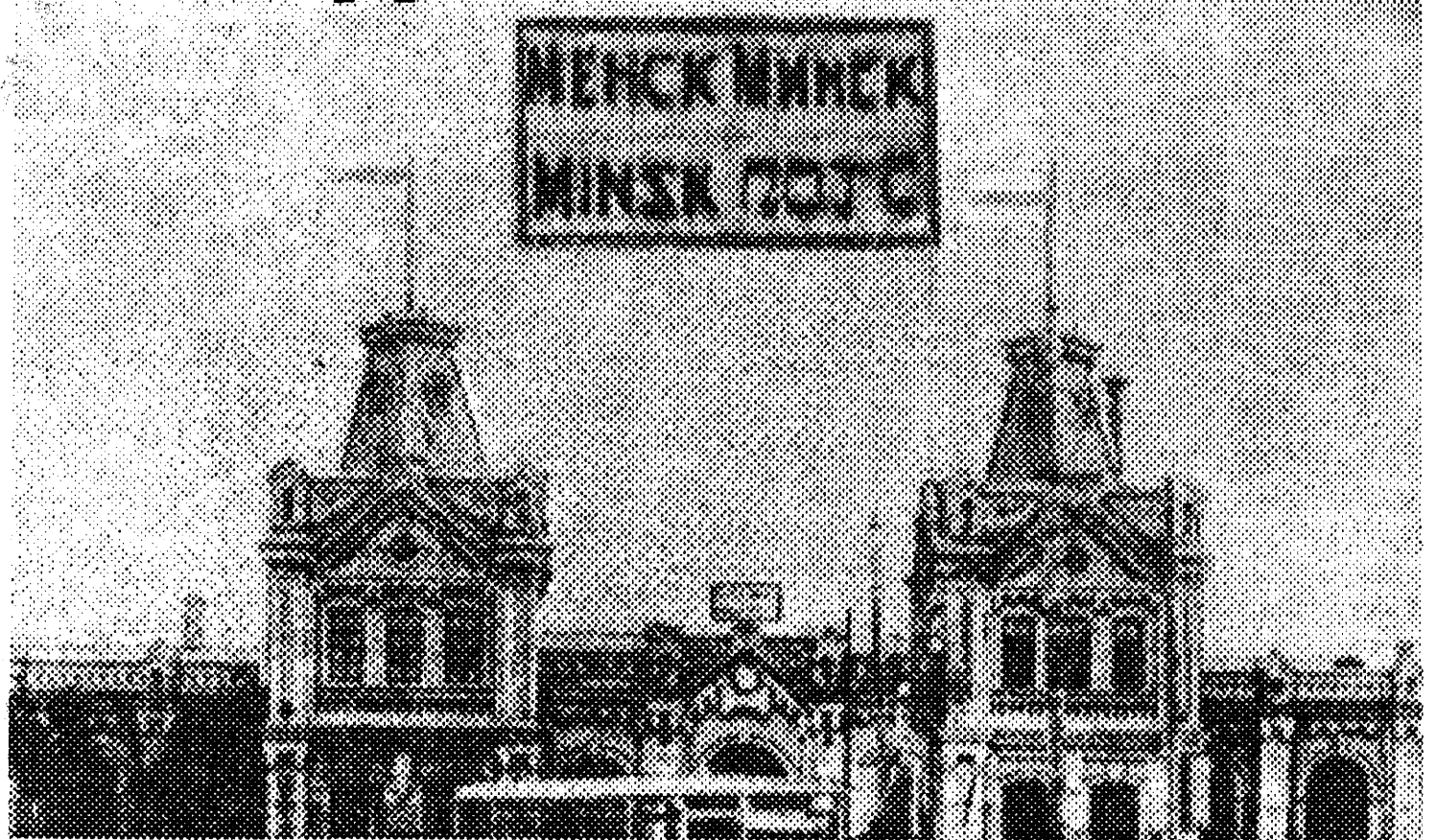
Чэрвень 1999. Менскі вакзал гатовы да дэпартацыі маскалёў