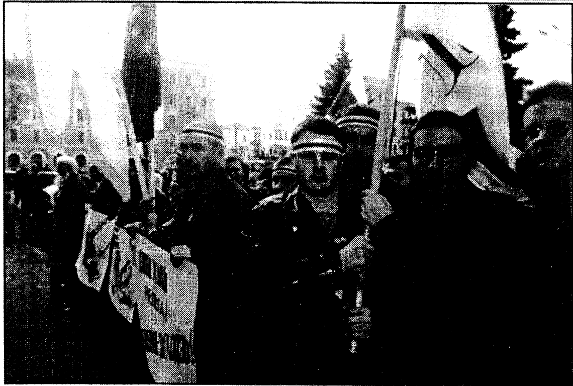
Віцебск: моладзь на выбары не пойдзе!

Ну а некаторыя Наваполацкія чыноўнікі ці то па загаду зьверху, ці то з “уласнае ініцыятывы” вырашылі, так бы мовыіць, падгуляць бутафорнаму фарсу пад назовам выбары. Супрацоўнікі бібліятэкі імя У.Маякоўскага вырашылі правесьці дэбаты кандыдадаў у дэпутаты. Зараз адбываюцца перамовы з прэтэндэнтамі на мандаты дэпутатаў. Мерапрыемства мяркуюцца правесьці недзе на пачатку кастрычніка. Прынамсі будзе цікава паназіраць, як кандыдаты ў рудэментарны орган будуць пераконваць, што яны дастойныя заняць месцы ў ім. Лепш бы гэтыя кандыдаты азнаёміліся з сучаснай заканадаўчай базай, што зараз рэгляментуюць працу дэпутацкага корпусу прэзідэнцкай палаткі. Тады б ім мусіць стала зразумелая бессэнсоўнасьць і іх дэбатаў, і іх удзелу ў фарсе пад назовам выбары.