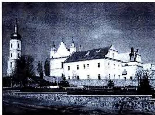
Катэдральны (былы езуіцкі) касцёл у Пінску.

Пяняцце Базылікі Меншай з’явілася каля 100 гадоў таму. Яно непасрэдна звязана з тытулам Вялікай Базылікі”, які з XVIII ст. надаецца выключна патрыярхальным базылікам. Яго маюць рымскія святыні св.Яна Хрысціцеля на Латэране, Маці Божай Большай, св.Пятра ў Ватыкане, св.Паўла за Мурамі, св.Лаўрэна і два храмы ў Асізі – св.Францішка і Найсвяцейшай Марыі Панны Анельскай. Гэтыя Базылікі падначалены непасрэдна Папе, таму ў кожнай з іх знаходзіцца папскі трон і алтар, на якім можа слу-