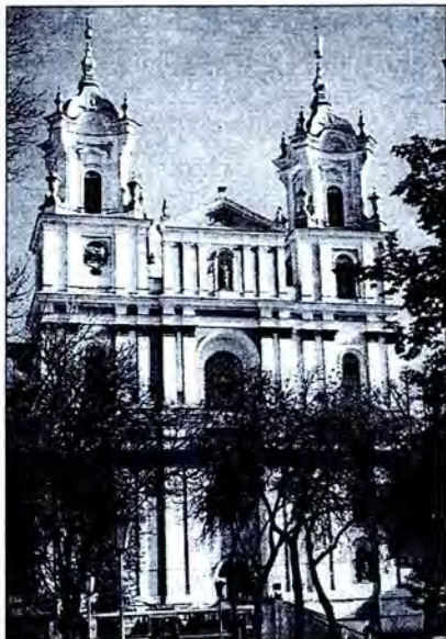
Фарны (былы взуіцкі) касцёл у Гродне.

– размясціць на франтоне Базылікі сімвалы Папы альбо Апостальскай Сталіцы.