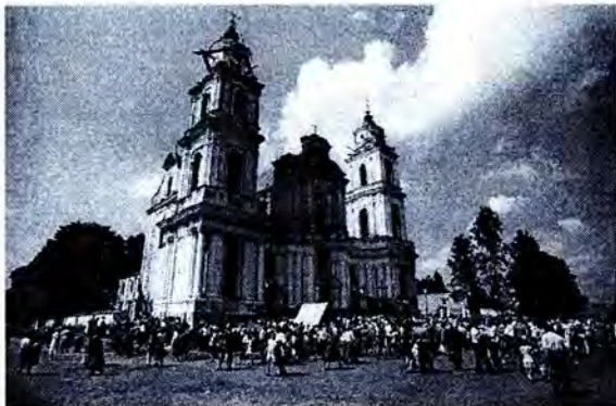
Касцёл у Будславе.

Словам “базыліка” ў Рыме называлі пэўны від свецкіх будынкаў. Яны падзяляліся на паралельныя наві. Прастора будынка стварала