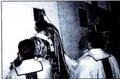
Падчас рэкансэкрацыі касцёла ў Пружанах.

Марыі Панны ў Пружанах (Брэсцкая вобл.). Веруючым спатрэбілася пяць гадоў, каб вярнуць да паўнаwartаснага жыцця святыню, пераробленую некалі на дом сацыялістычнай культуры. Пробашчам у Пружанскай парафіі з'яўляецца кс.Эдвард Лоек СМ.