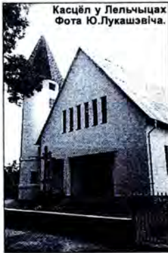
Касцёл у Лельчыцах

14 жніўня з удзелам кардынала Казіміра Свэнтэка адбылася ўрачыстая рэкансэкрацыя касцёла Унебаўзяцця Найсвяцейшай