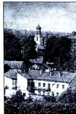
Вільня, касцёл св.Барталамея.

Касцёл будзе мець статус рэктаральнага, ён