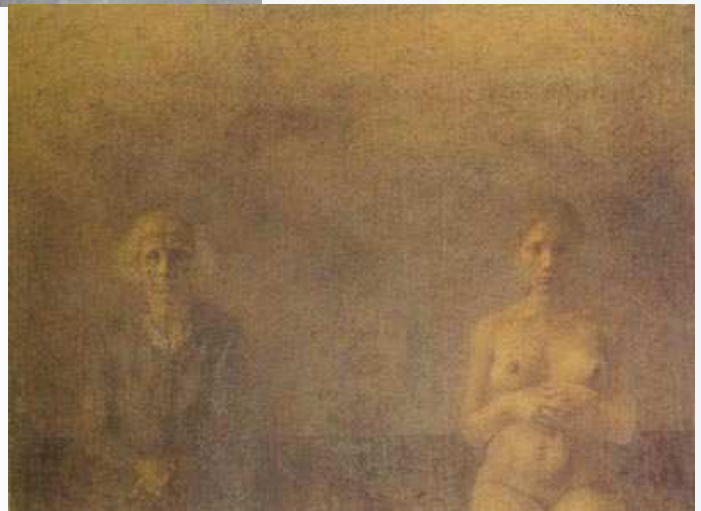
Старая кабета і маладая аголеная, 1998