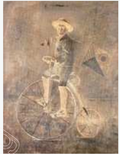
Хлопчык на ровары, 2003