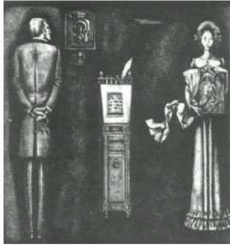
Ілюстрацыя да апавесці Ф. Дастаеўскага “Пакорлівая”