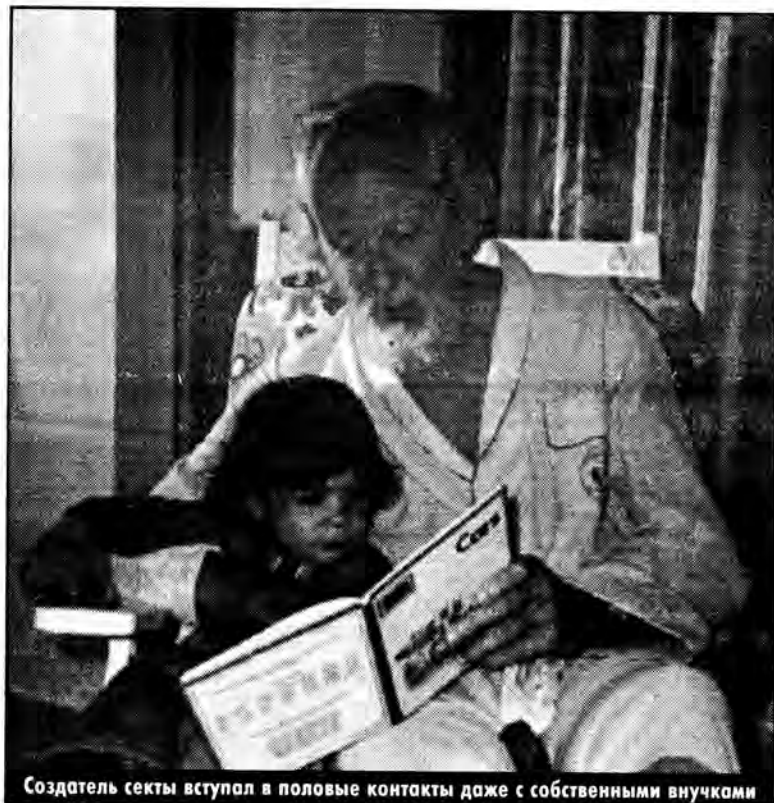
Создатель секты вступал в половые контакты даже с собственными внуками