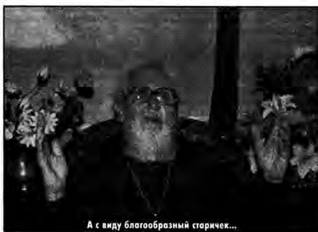
А с виду благообразный старичек...

— Был момент затаенного юношеского максимализма. Когда нас ехидно спрашивали: «Может, вы хотите присоединиться к этой «Семье», бросить родителей?» — мы на это резко реагировали: «Да, мы уедем!» Взрослые поступили жестоко — нам запретили встречаться, и деятельность