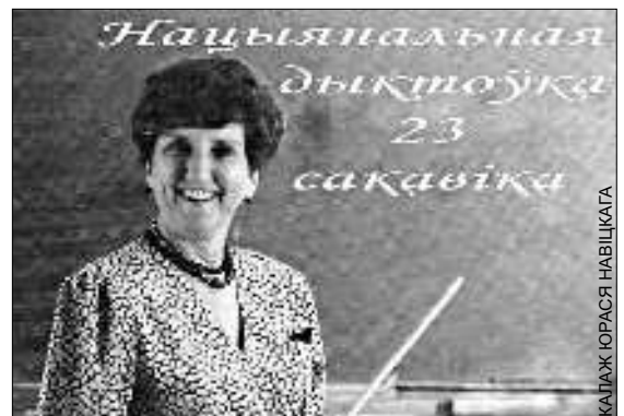
КАЛАЖ ЮРАСЯ НАВІЦКАГА