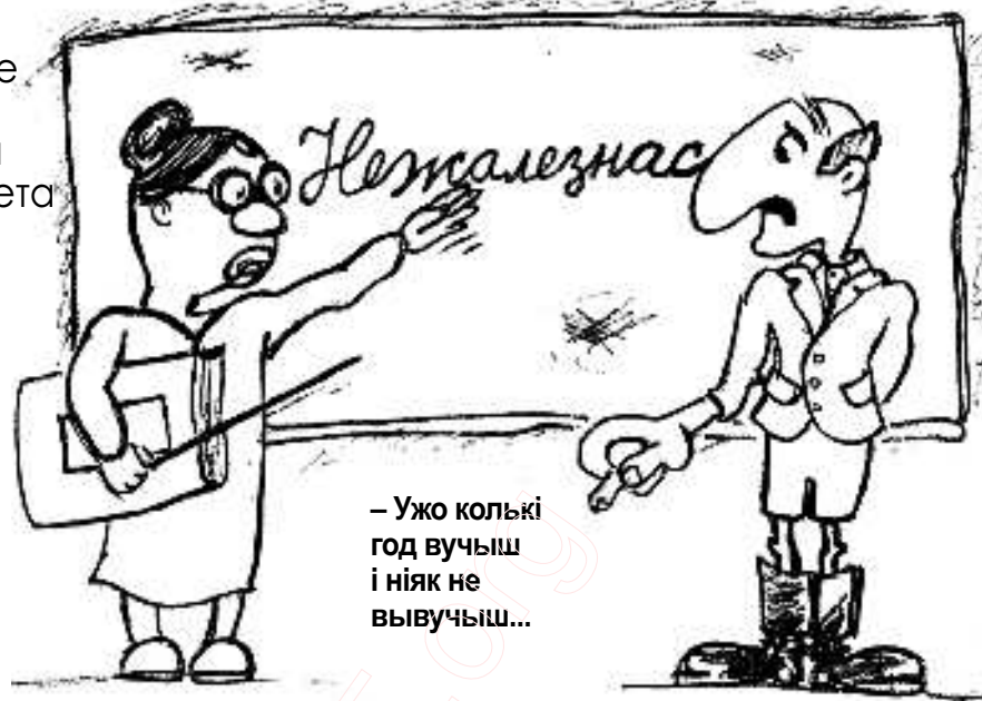
МАЛЮНАК ЮРАСЯ НАВІЦКАГА

Апроч звыклага шэсця і канцэртаў з вечарынамі прапануецца імпрэза, здольная паяднаць людзей рознага веку, мастацкіх густаў, фізічных здольнасцяў і нават палітычных поглядаў. Уся гэтая гаворка – пра дыктоўку! З чым атаясамліваецца ў вас гэнае слова? Слушна, абуджаюцца ўспаміны дзяцінства – школа, парты, настаўніца, напаятая цішыня ў класе... Але ж гэтым разам усё будзе інакш. Дзяржаўныя ўстановы не будуць мець да гэтай дзеі ніякага дачынення; усе захады робяцца грамадскасцю пад апекай створанага арганізацыйнага камітэта. Зацверджаны аргкамітэтам тэкст напішам мы ўсе разам – малыя, сталыя і старыя, левыя, цэнтрысты і правыя, журналісты, эканамісты і настаўнікі. Мы – беларусы, якія адчуваюць сваю прыналежнасць да эўрапейскай нацыі і гэтым ганарацца. Такія акцыі ладзяцца ў нашых