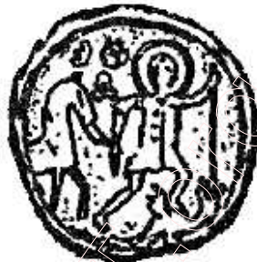
Ярыла-Юрай злазіць з каня і забівае зьмея. Гэрбы князя Аляксандра Неўскага “Пагоня” і “Сьв. Юрай”, пад якімі ён вёў беларусоў у бой на Няве і на Чудскім ставу. А вось нябёсны вершнік зь пячаткі караля Літоўскага