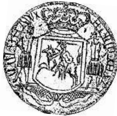
Гэрб гаспадарсьцтва, узяты ў 1252. Кароль Літоўскі і Рускі Міндоўг.