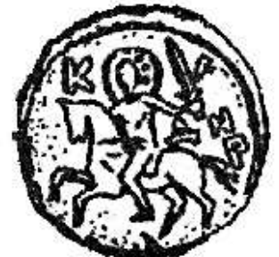
і Рускага Гедзіміна скача на кані з доўгаю дзідаю ўва ўзьнятай руцэ. Полацкая Пагоня 1330+, як і два вершнікі зь пячатак караля Літоўскага, Рускага і Жамойцкага Вітаўта скачуць на Ўсход. Туды ж кіруе сваю дзіду Сьв. Юрай-зьмееборац.