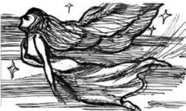
МАЛЮНКІ ЮРАСЯ НАВІЦКАГА